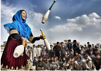
TABLE RONDE - cirque social